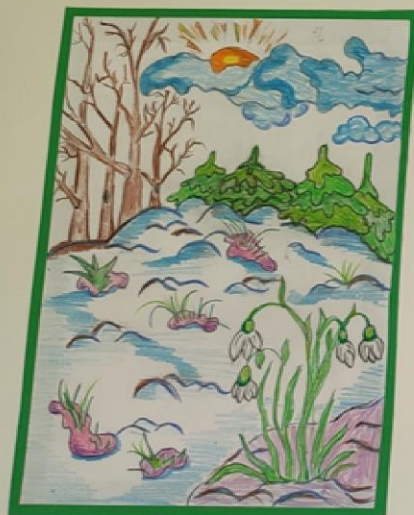
Весна-девица – подснежников царица.