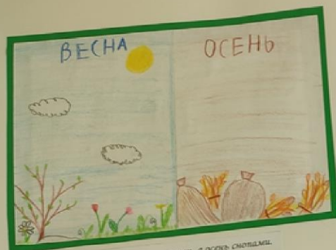
Красна весна цветами, а осень снопами.