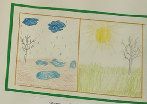
Март с водой, апрель с травой.