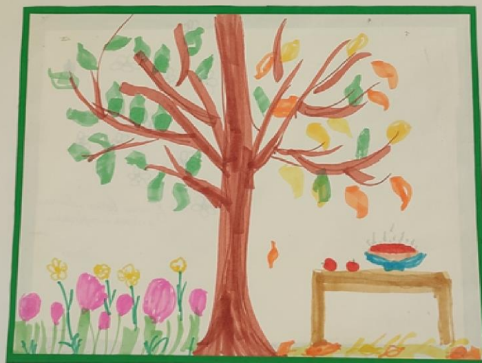
Красна весна цветами, а осень пирогами.