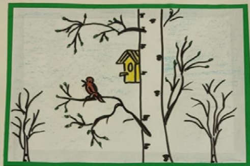
Увидел скворца, встречай весну у крыльца.